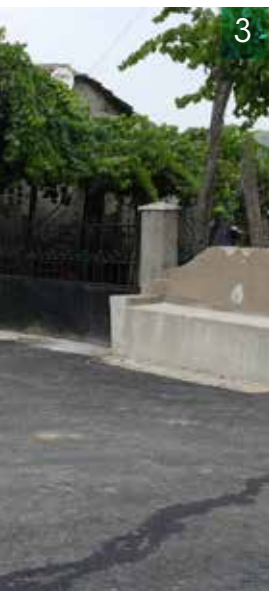
1, 2, 3 e 4 - Asfaltamento - Santa Cruz 5 - Construção de muro - Travanca 6 - Construção de muro de contenção de terras - Travanca