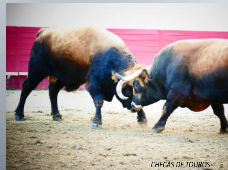
CHEGAS DE TOUROS