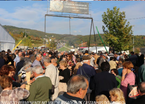
MAGISTRO PERMANENTE NO MAIOR ASSADOR DE CASTANHAS DO MUNDO