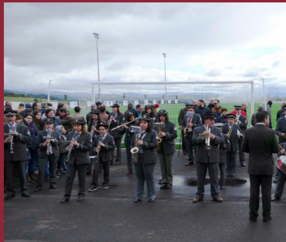
ATUAÇÃO DA BANDA FILARMÓNICA DE REBORDELO