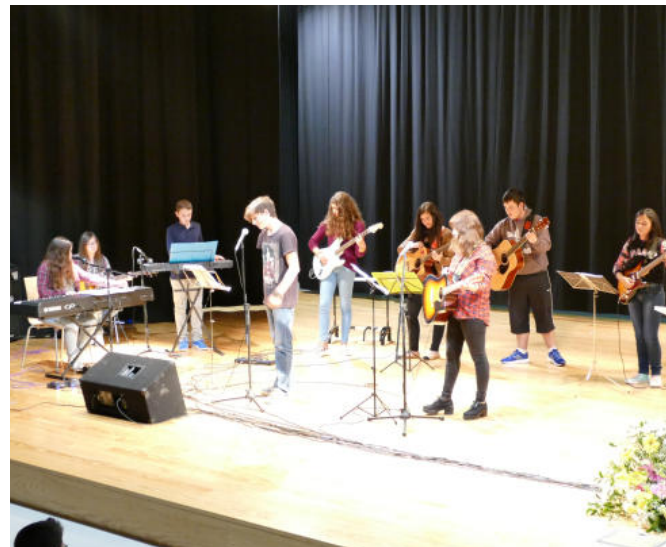
ATUAÇÃO DOS ALUNOS DA ESCOLA MUNICIPAL DE MÚSICA