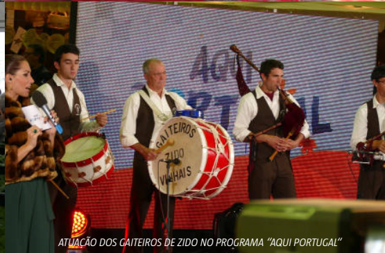
ATUAÇÃO DOS GAITEIROS DE ZIDO NO PROGRAMA "AQUI PORTUGAL"