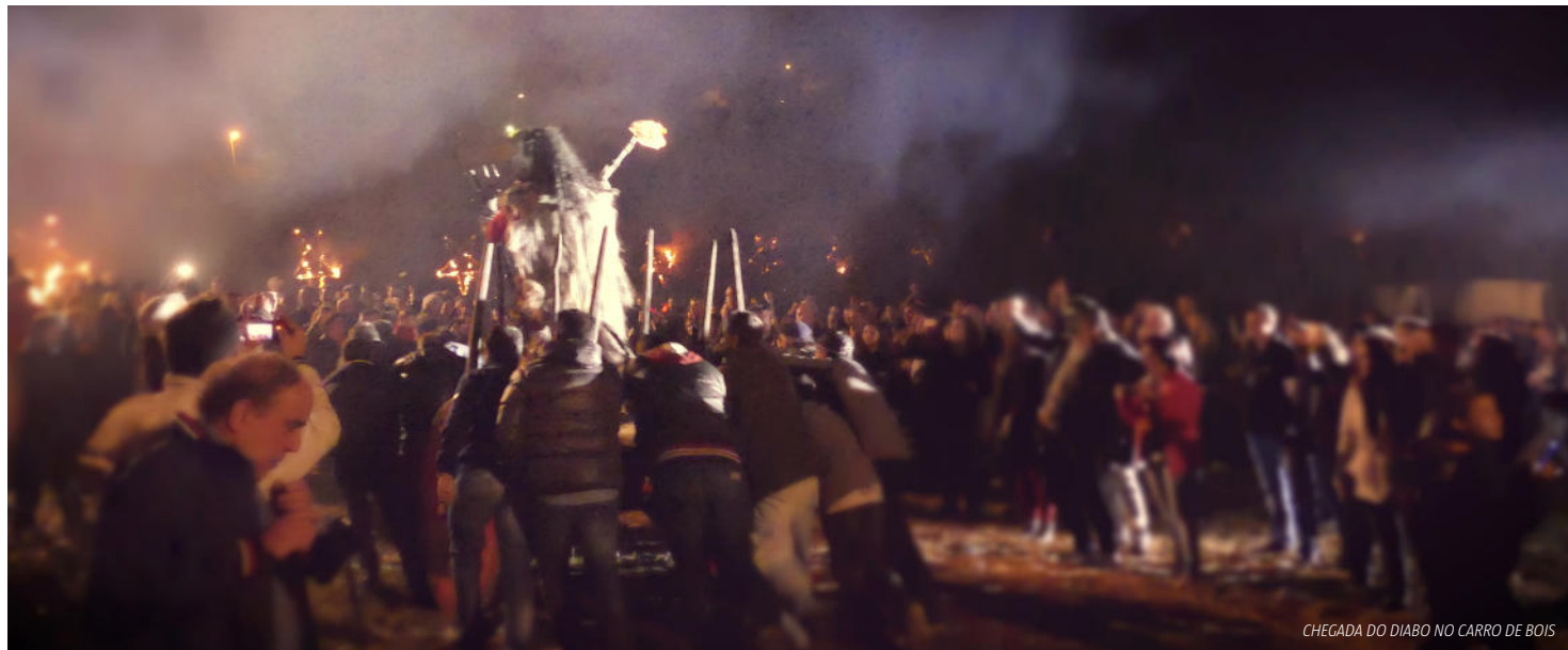
CHEGADA DO DIABO NO CARRO DE BOIS