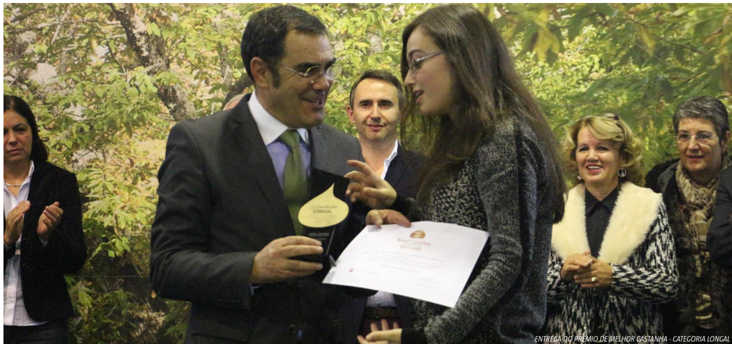
ENTREGA DO PRÉMIO DE MELHOR CASTANHA - CATEGORIA LONGAL

representa 70% da produção nacional. No que diz respeito à utilização deste fruto na gastronomia, a castanha é utilizada desde os pratos principais como javali com castanhas, lombo de porco com castanhas, até às sobremesas como tarte de castanha, pastel de nata com castanha ou bolo-rei de castanha. Por este motivo, há vários anos que se realiza, durante a Rural Castanea, o