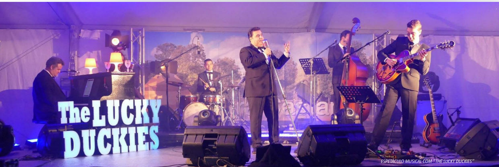
ESPETÁCULO MUSICAL COM "THE LUCKY DUCKIES"