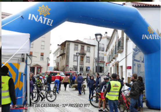
TOUR DA CASTANHA - 12º PASSEIO BTT