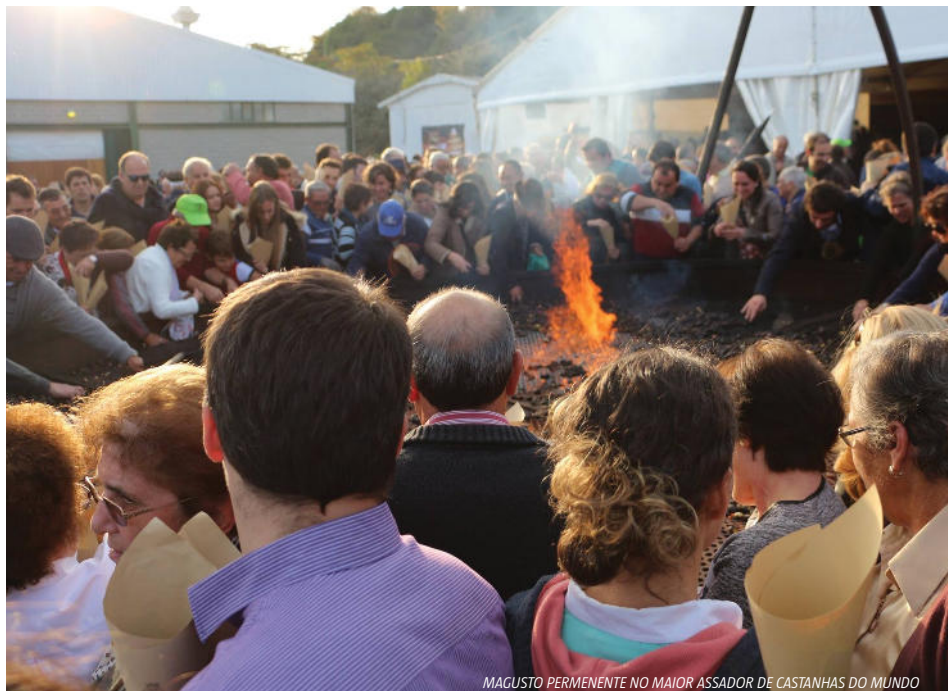
MAGUSTO PERMANENTE NO MAIOR ASSADOR DE CASTANHAS DO MUNDO

A rainha da festa é a castanha que tem vindo a assumir um papel fundamental na economia da região, sendo que a produção nos concelhos de Vinhais e Bragança