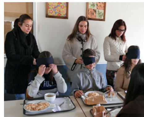
“ALMOÇO ÀS CEGAS”

de rodas e canadianas, que tiveram por objetivo a inclusão social. As comemorações deste dia terminaram com a pintura de um painel.