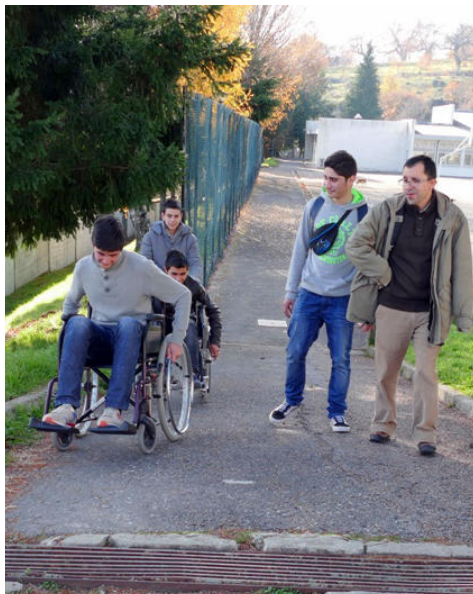
PERCURSO EM CADEIRAS DE RODAS

Realizou-se a 3 de dezembro, uma Ação de Sensibilização Escolar a fim de comemorar o Dia Internacional das Pessoas com Deficiência. A organização ficou a cargo da Câmara Municipal de Vinhais, com o apoio do Agrupamento de Escolas de Vinhais, Vinhais Solidária – Associação de Apoio a Pessoas com Necessidades Especiais e Laboratório Eng.º Jaime Filipe - CERTIC – Centro de Engenharia de Reabilitação e Acessibilidade