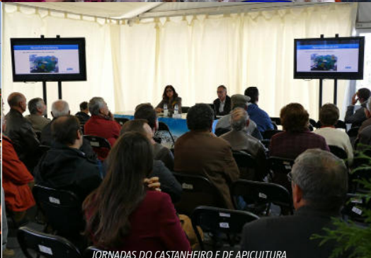
JORNADAS DO CASTANHEIRO E DE APICULTURA