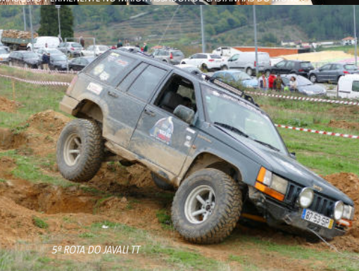
5ª ROTA DO JAVALI TT