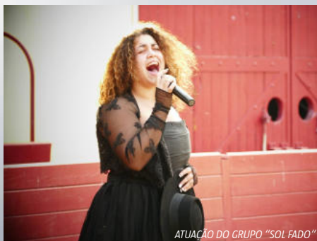
ATUAÇÃO DO GRUPO "SOL FADO"