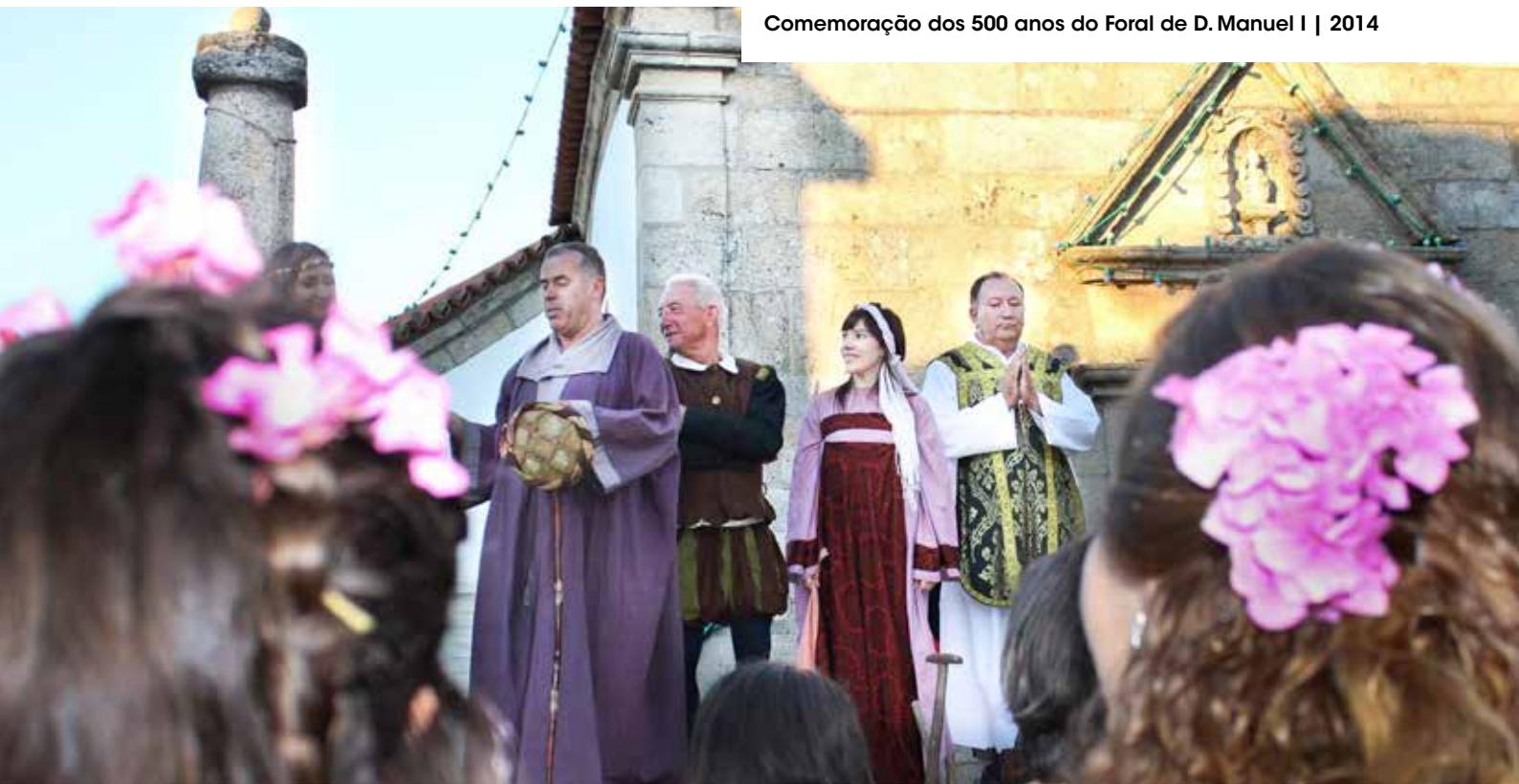
Comemoração dos 500 anos do Foral de D. Manuel I | 2014

Foram tempos áureos vividos em Ervedosa, pois há mais de 50 anos, a aldeia já tinha água canalizada, uma central eléctrica, cinema a manivela, calçadas de granito, bens e serviços que poucos locais tinham, tudo