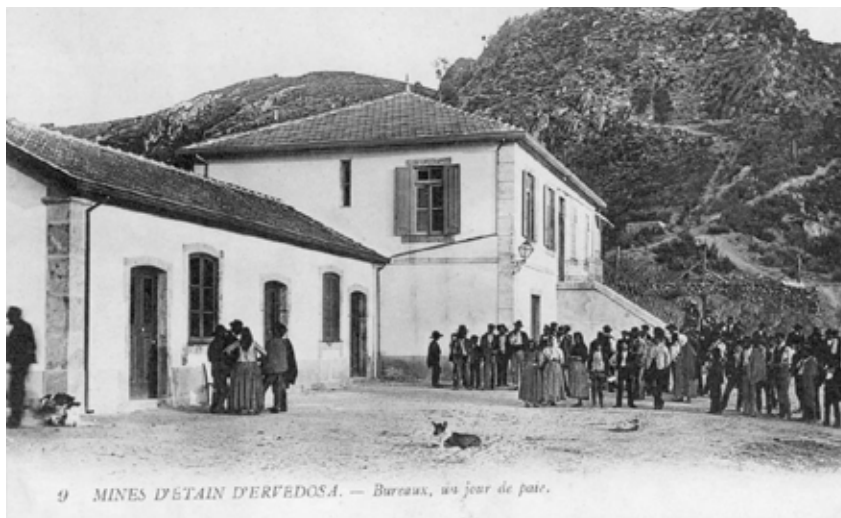
9 MINES D'ÉTAÏN D'ERVEDOSA. — Bureaux, un jour de fête.