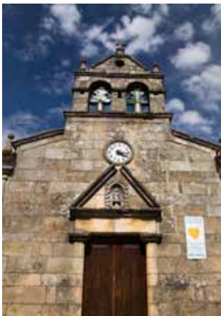
Igreja de São Martinho À direita: Capela de Santa Ana

Quando se visita esta zona, onde o castelo outrora foi erguido, é possível verificar a existência de um torreão,