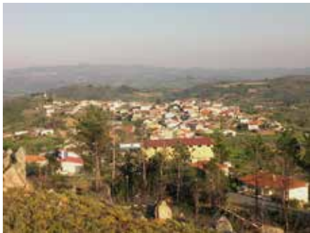
Povoado fortificado implantado num morro, enquadrado no topo de uma crista quartzítica.